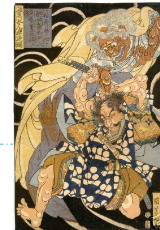
一条戻り橋で鬼の腕を切り落とす渡辺綱