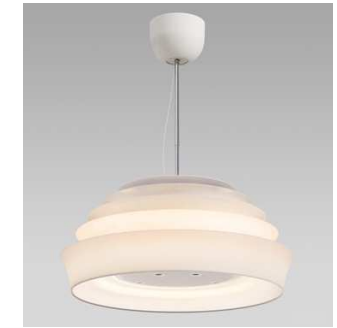
L Cタイプ 88,200円 W550×D550×H550~750