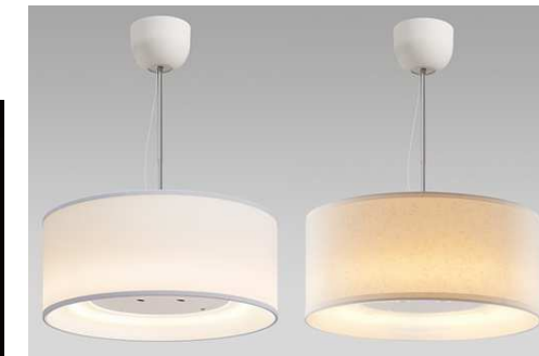
H Lホワイト 麻入り和紙