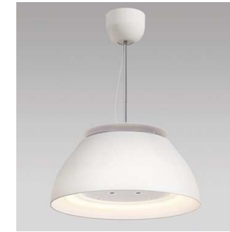
L Bタイプ 77,700円 W500×D500×H550~750

ファン 脱臭フィルター 調理時のニオイを除去 脱煙フィルター 調理時の煙を除去 ※SEK基準「制菌加工」 脱油フィルター プレフィルターを通り抜けた油を吸着 プレフィルター 調理時の油を捕獲