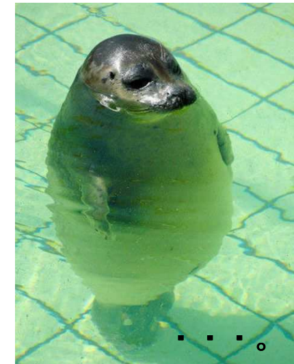
。 。 。