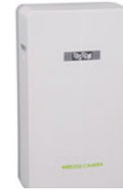
<ワイレスドアカメラ部>

「モニッコ」は、ドアスコープの室内側にカメラを取り付け、玄関前の映像を室内用小型カラーモニターへワイヤレスで送信し、手軽に確認できるシステムです。工事が不要で、自分で簡単に取外しができます。室外側には取り付け機器がないため、テレビドアホンを後付け工事できない、賃貸アパート・マンションにも最適です。玄関ドアへ設置するワイレスドアカメラ部は、一般的な玄関ドアの多くに取り付けが可能で、また、電源を乾電池(単3形アルカリ乾電池×3本)とすることで、コンセントなどへの配線も一切不要です。別売のオプションで、ワイヤレス室内用カメラを増設(最大3台まで)可能です。睡眠中のお子様の状況を、離れたリビングなどから、簡単にカメラを切り替えて確認することができます。「モニッコ」は、事前に顔を確認してから対応できるので防犯面でも安心です。また、ドアスコープに背が届かない小さなお子様の留守番の際や、ご年配の方にも適しています。